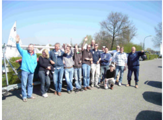
De trainers en deelnemers 2010