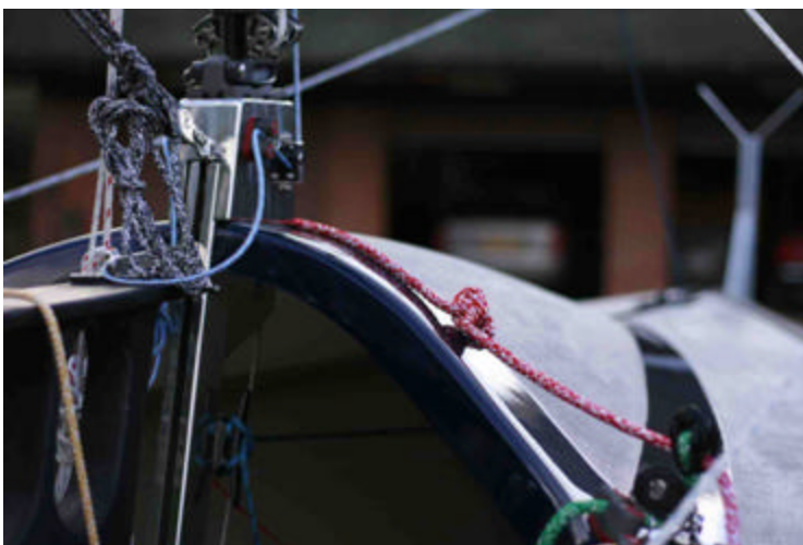
Nieuwe De kloet EFSIX in alle RAL kleuren verkrijgbaar