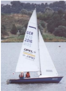
2016, Wat een plezier